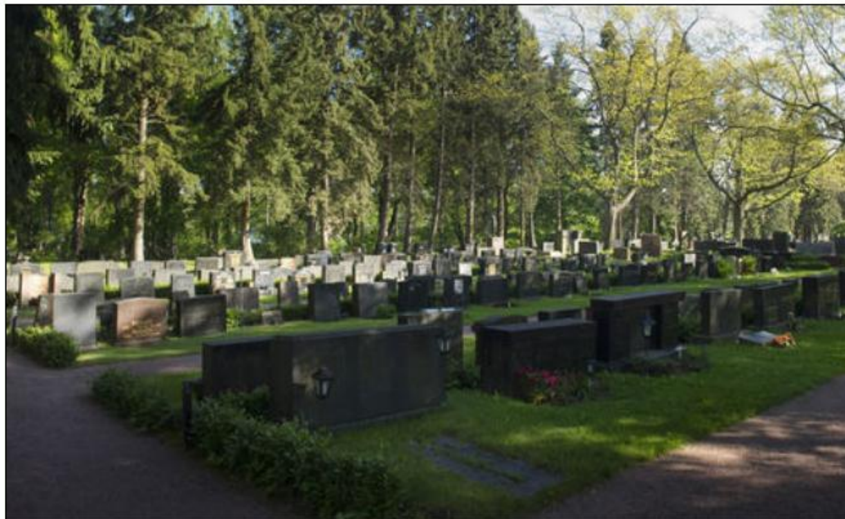
Monet seurakunnat ovat kieltäneet koirat kieltotauluin.

Koirien tuominen hautausmaalle tahdotaan estää nykyistä järeämmin keuin.