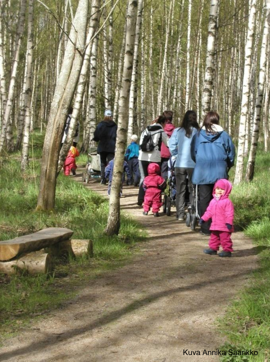
Kuva Annika Saarikko